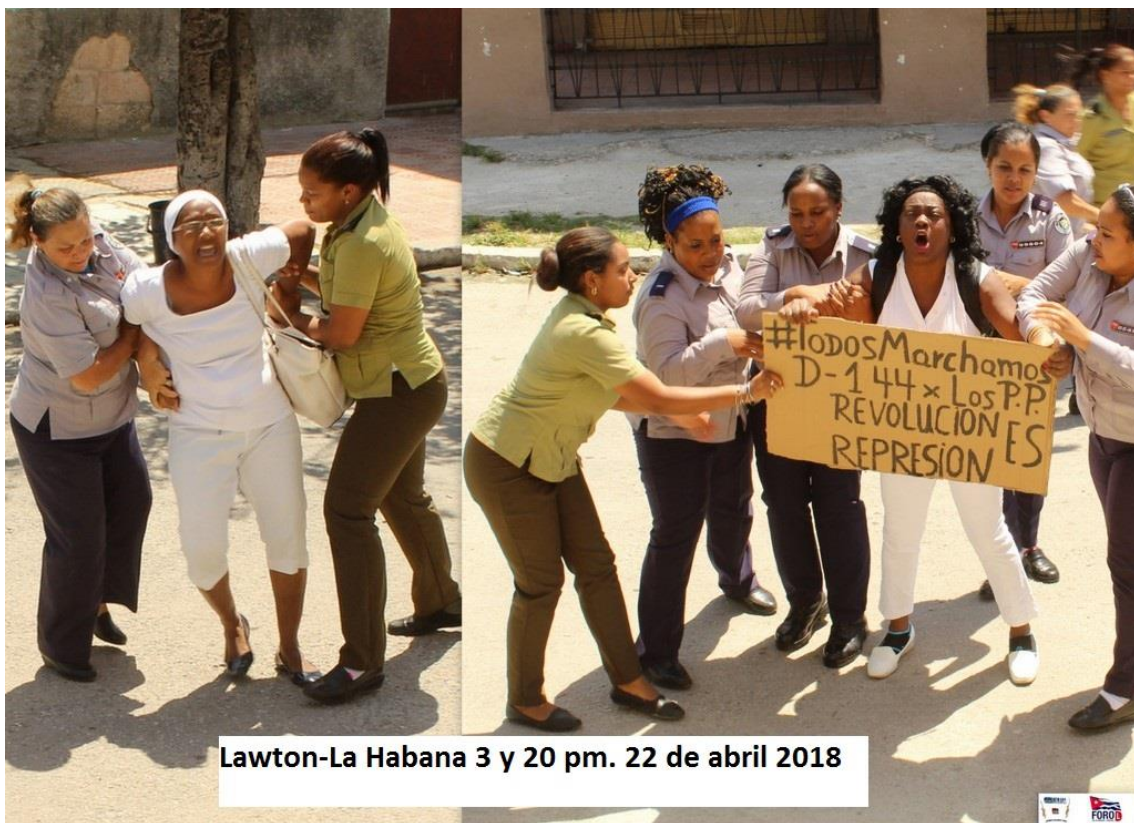
Lawton-La Habana 3 y 20 pm. 22 de abril 2018